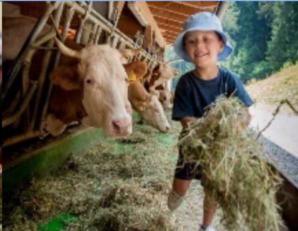
Schule am Bauernhof